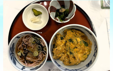
本日のお食事(ウニ丼)