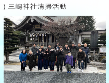
2025年12月13日(土) 三嶋神社清掃活動