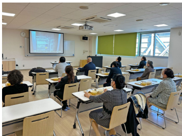
給食センターの 紹介動画を鑑賞