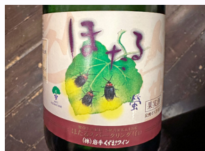
乾杯のシャンパン (赤・白)